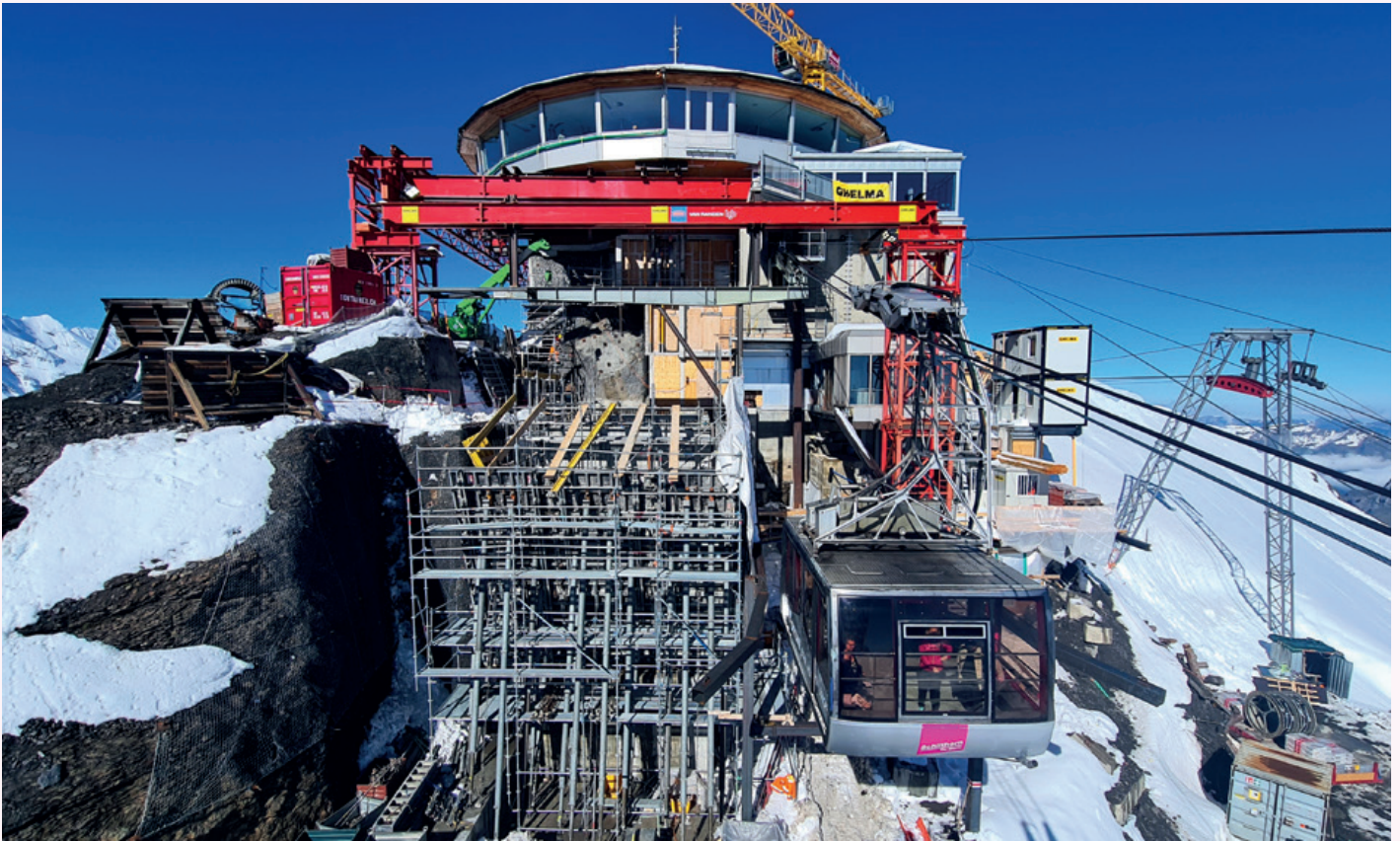
Gipfelgebäude Schilthorn – Piz Gloria