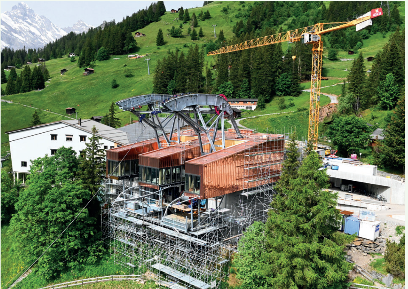
Station Mürren