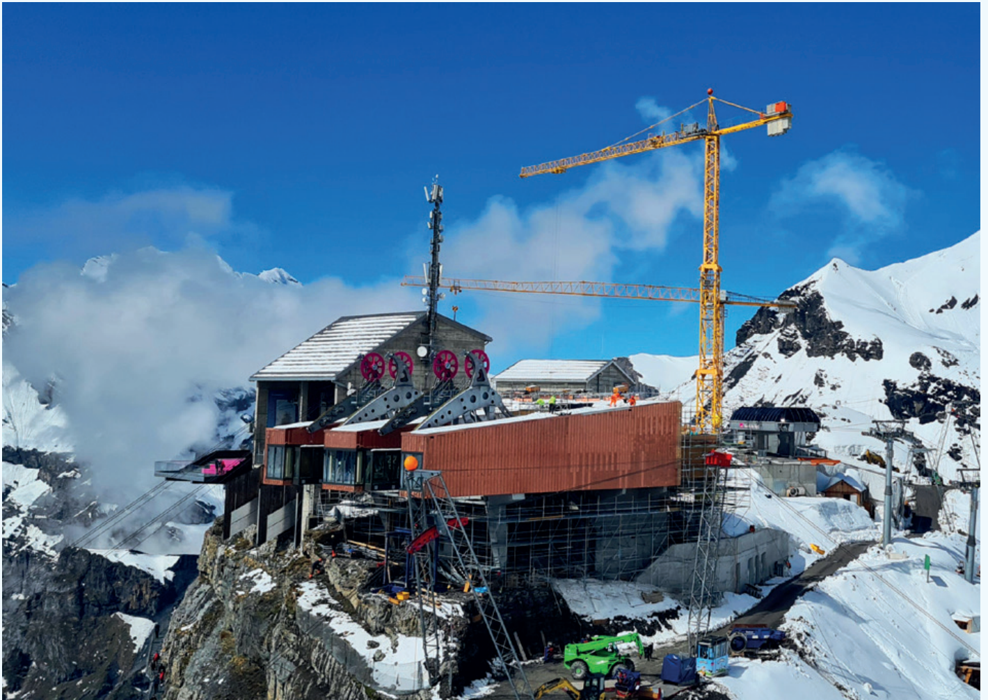
Bergstation Birg