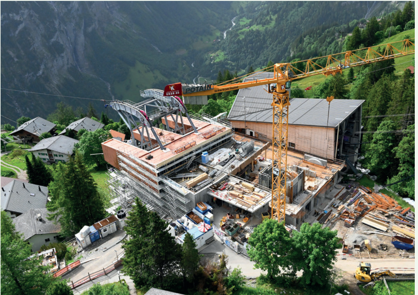
Station Mürren