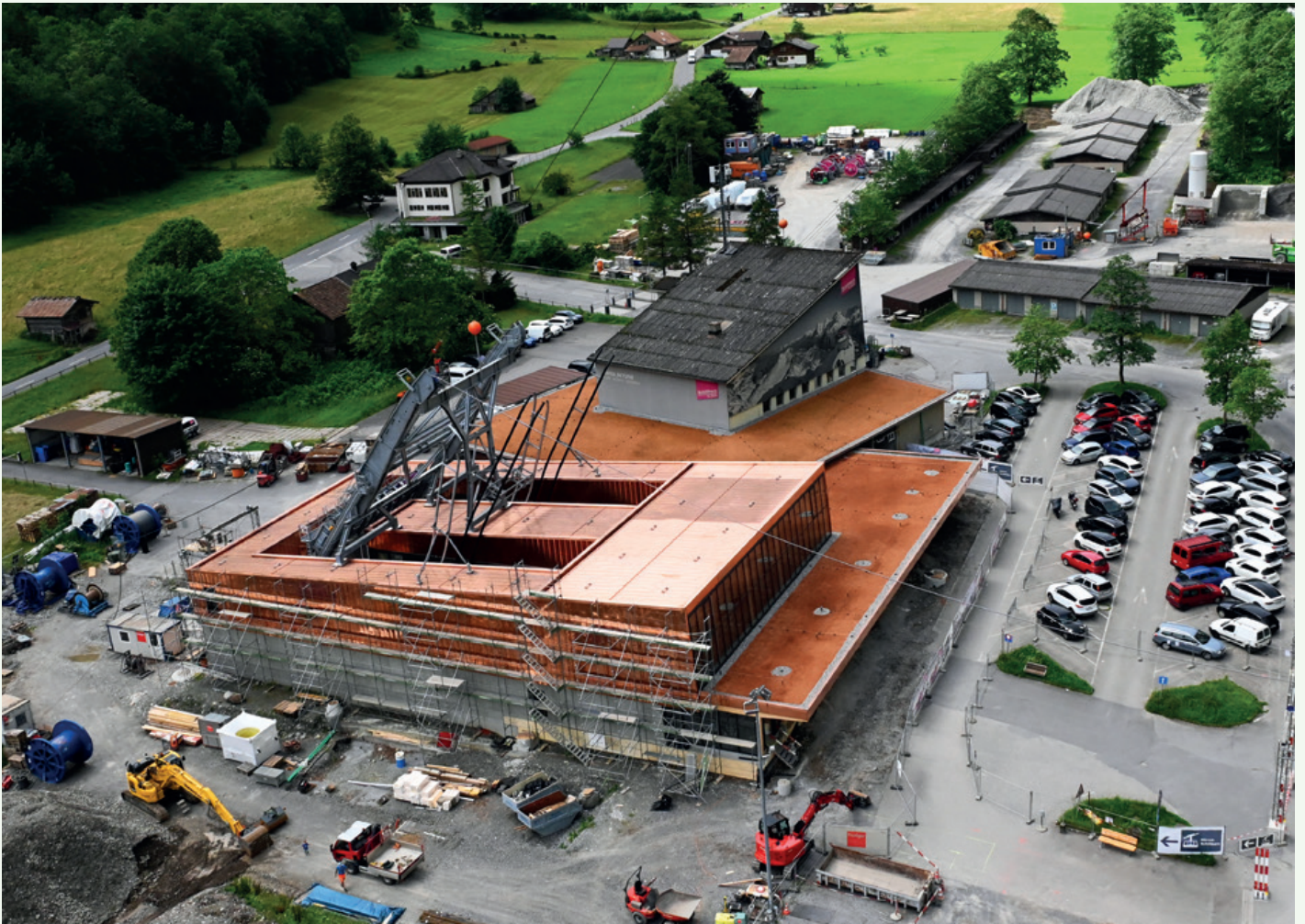
Station Stechelberg