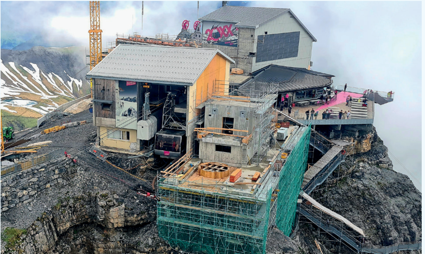
Talstation Birg